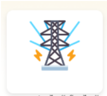
ระบบขอซ่อมไฟฟ้าโคมไฟฟ้า สาธารณะ

ขั้นตอนที่ 1 เลือก “ขอซ่อมไฟฟ้า โคมไฟฟ้าสาธารณะ”